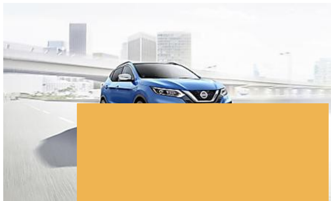
Nissan QASH permuta/rott (Nissan)