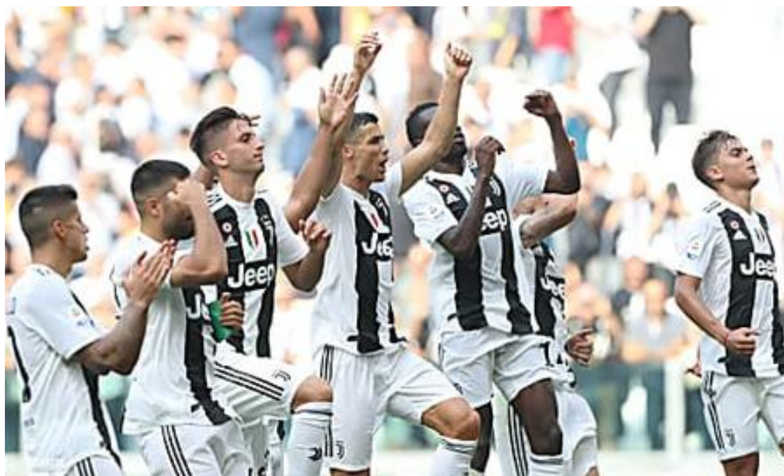
Un investimento di 200 € adesso sulle Azioni della Juventus potrebbe rendere 1 Milione di € in solo.. (Vici Marketing)