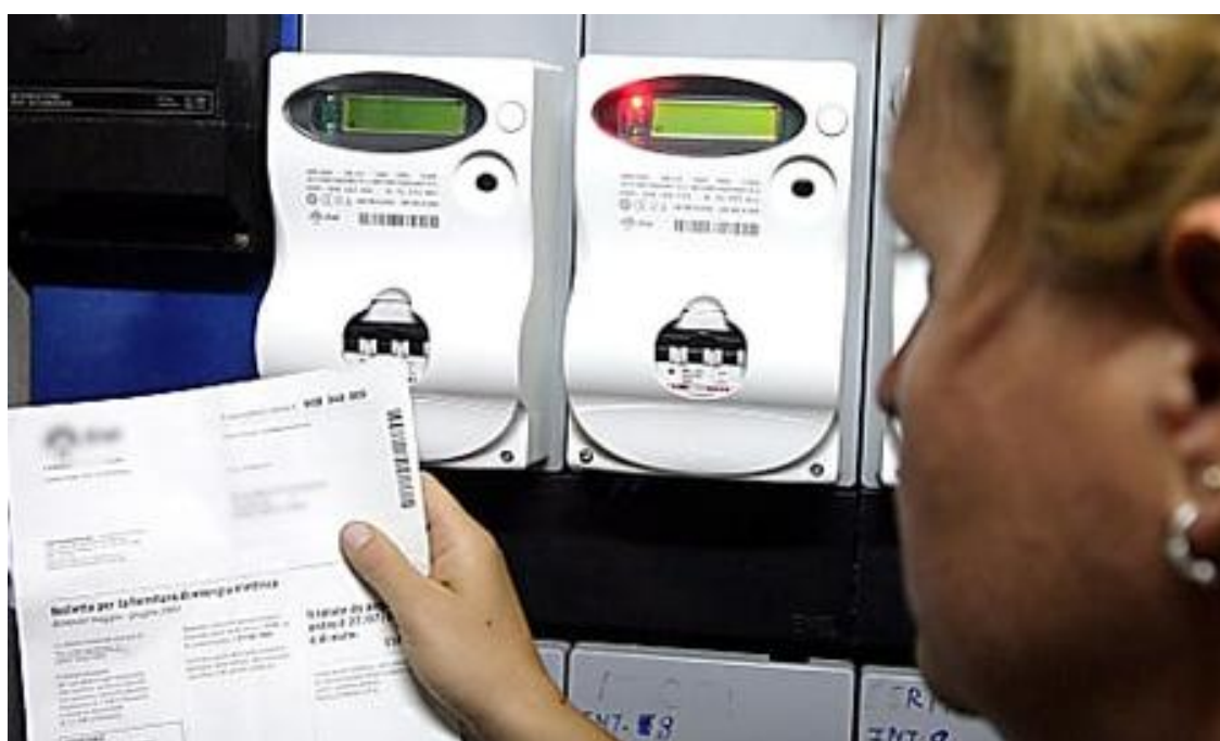
Quale fornitore luce e gas scegliere nel 2019? Scopri il più conveniente ( www.comparaerisparmia.com )