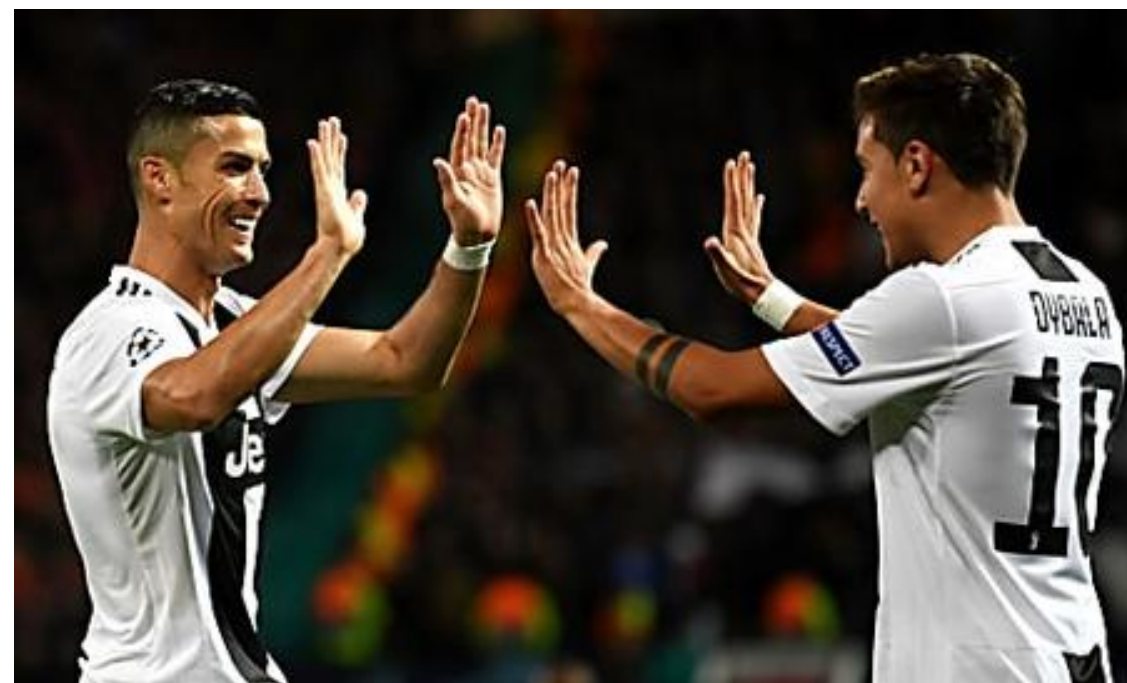
Il valore delle azioni della Juventus vola alle stelle, adesso è davvero il momento migliore per... (Vici Marketing)