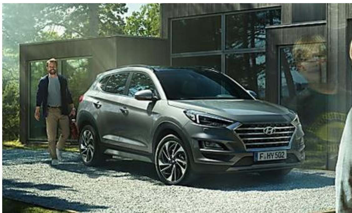
Nuova Tucson. A gennaio tua con zero rate per 2 anni*. Scopri di più (Hyundai)