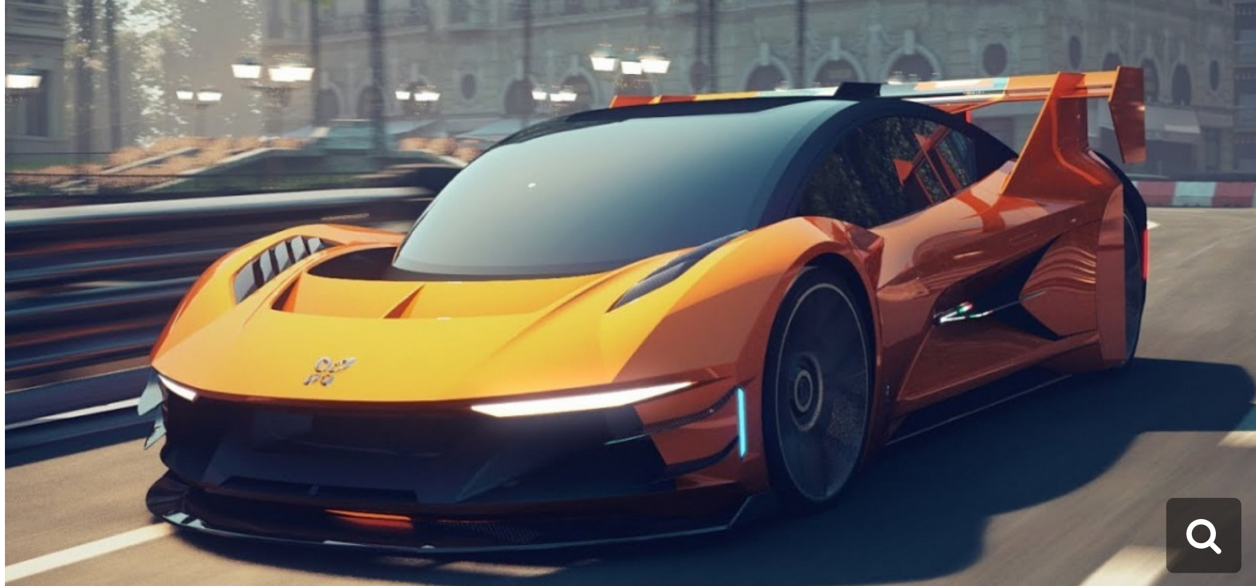
Dianchè Bertone BSS GT One

Flymove a commencé à accepter les pré-commandes depuis le 15 janvier, et annonce que les premières livraisons des neuf exemplaires de chaque voiture devraient avoir lieu au début de 2020. Ces deux supercars disposent d'un moteur électrique sur chaque essieu. La BSS GT One affiche une puissance combinée de 400 ch, la BSS GT Cube environ le double, pour une vitesse maximale de 350 km/h et un 0 à 100 km/h en 2,2”.