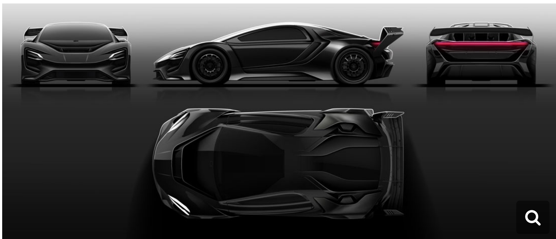
Dianchè Bertone BSS GT One

Les voitures ont été conçues pour des batteries de 100 kWh. Pour info, Flymove envisage de remplacer les stations de recharge par un système d'échange de batteries BSS, Battery Swap System, en trois minutes environ. La société a annoncé qu'elle commencerait à installer les premières stations Point of Energy en Italie cette année.