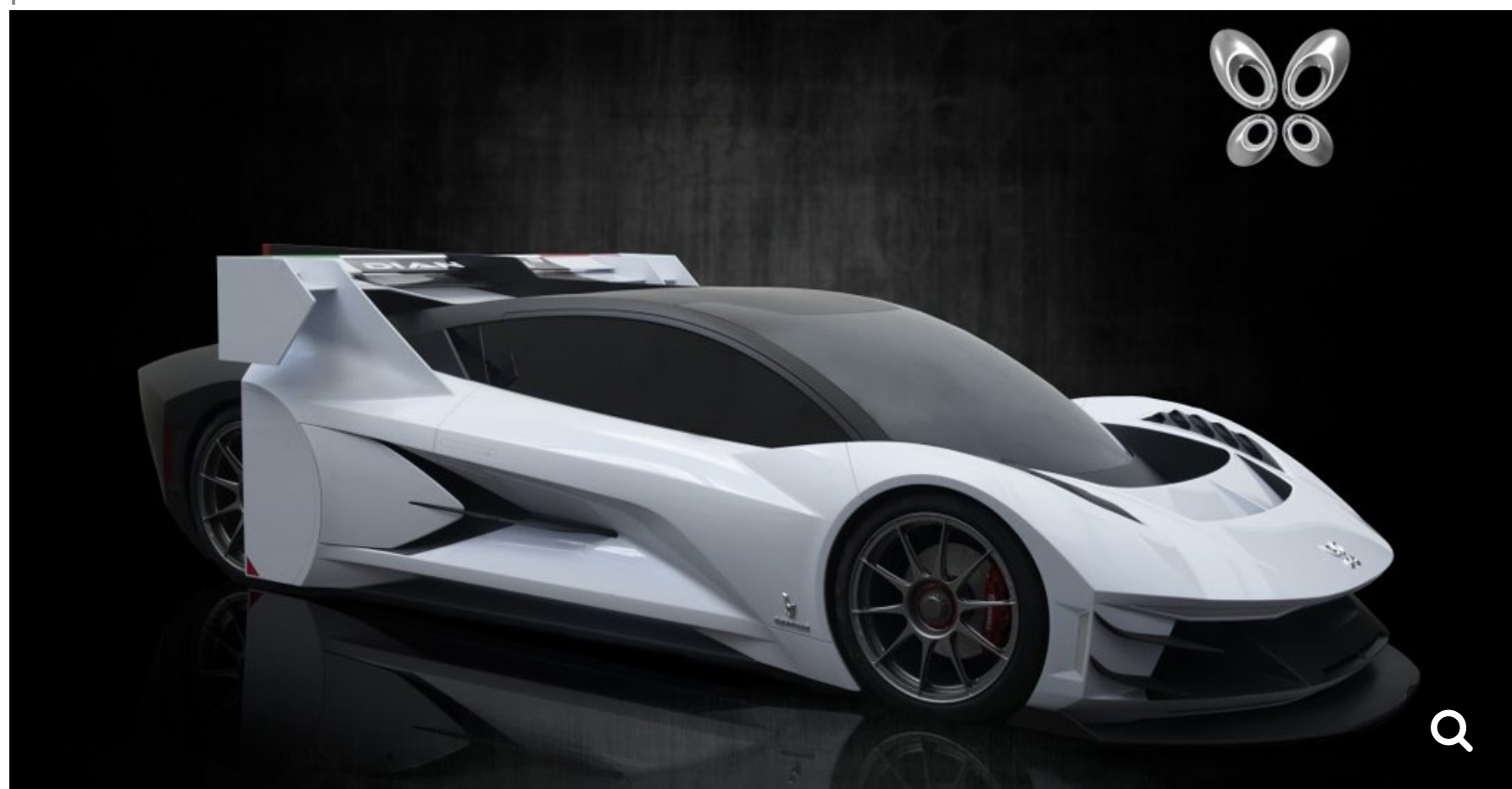
Dianchè Bertone BSS GT Cube

Flymove envisage une gamme de voitures électriques à batteries échangeables sous la marque Dianchè. Lors d'un événement organisé à Milan à la fin de l'année 2018, les premiers modèles ont été présentés en plus de leur système Battery Swap System BSS. Flymove envisage deux supercars électriques, la Dianchè Bertone BSS GT One et la BSS GT Cube.